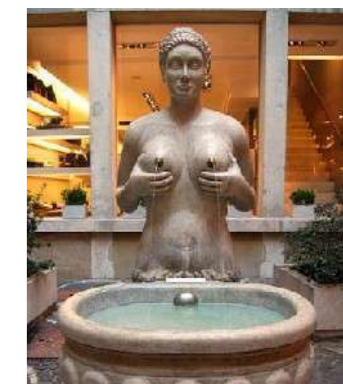
Fontana delle Tette