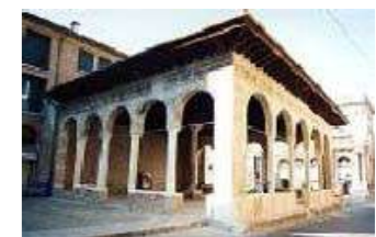
Loggia dei Cavalieri