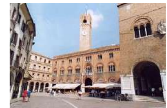
Piazza dei Signori