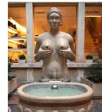
Fontana delle Tette