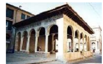
Loggia dei Cavalieri