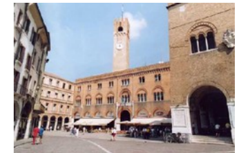
Piazza dei Signori