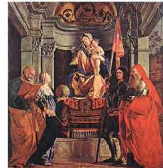
4. Pala di Lorenzo Lotto Santa Cristina al Tiveron Quinto di Treviso