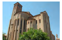
Tempio di San Nicolò