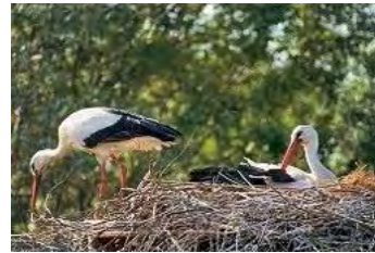
8. Zona naturalistica Sant'Elena di Silea