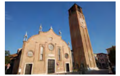
Santa Maria Maggiore