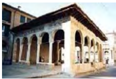
Loggia dei Cavalieri