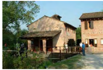
3. Parco Naturale del Sile Oasi Naturalistica di Cervara Santa Cristina di Quinto