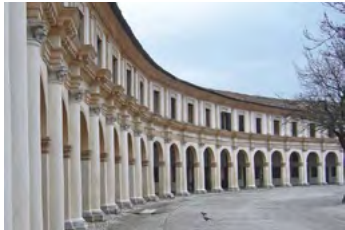
2. Rotonda Badoere