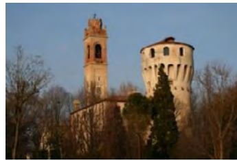
5. Torre Carrarese (XIV sec.) Casale sul Sile