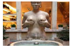
Fontana delle tette