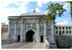
Porta San Tomaso