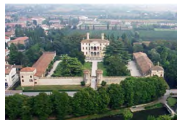
9. Castello Giustinian (primo '500) Roncade