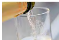
Il Prosecco DOCG