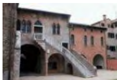
Museo Casa da Noal