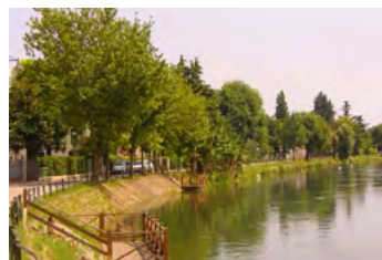
7. Zona naturalistica Alzaia, Treviso