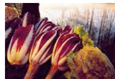
Radicchio di Treviso