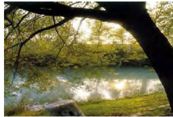
6. Zona naturalistica Lughignano Casale sul Sile