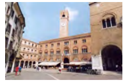
Piazza dei Signori