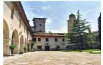
10. Santa Maria del Pero Ex Abbazia Benedettina X secolo Monastier

Per maggiori informazioni su manifestazioni, mostre ed eventi a Treviso e dintorni, visitate il sito www.marcadoc.it