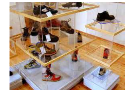
Museo dello Scarpone