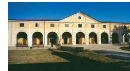
Museo Civico Bellona