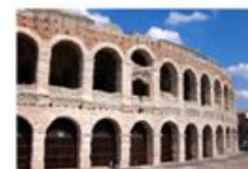
Verona and Garda Lake