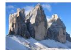
Dolomites - Cortina

Testi e Fotografie: Provincia di Treviso, Associazione Altamarca. Altre fonti: internet.