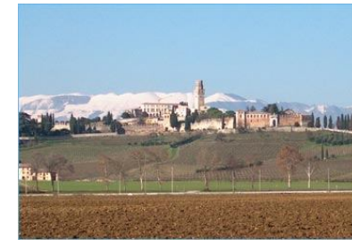
Il Castello di San Salvatore

Le vicende di epoca medievale sono segnate dalla presenza dei grandi feudi come quello degli Ezzelini che con la loro politica segnarono fortemente la destra Piave; non meno importanti le potenti famiglie dei da Camino , dei da Carrara , dei Brandolini e dei Collalto dei quali è tutt'oggi visibile l'imponente castello di San Salvatore , presso Susegana, considerato una delle più belle dimore gentilizie d'Italia.