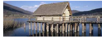
Parco Archeologico del Livelet

Per scoprire invece i segreti del tempo preistorico è stato creato, sulle sponde dei laghi di Revine Lago, il Parco Archeologico Didattico del Livelet dove il visitatore può rivivere la quotidianità degli uomini antichi in uno scenario davvero suggestivo.