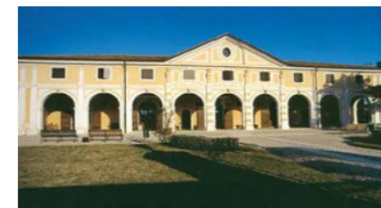
Museo Civico Bellona