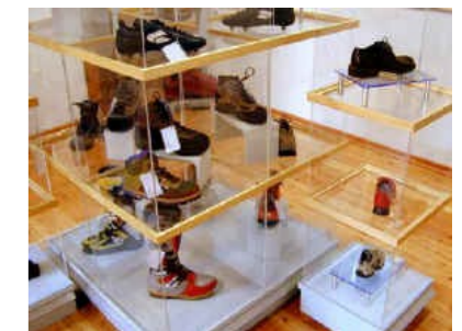
Museo dello Scarpone