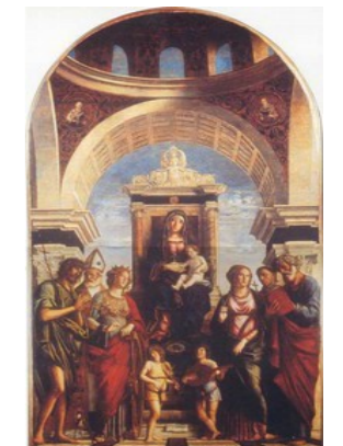
Pala del Cima