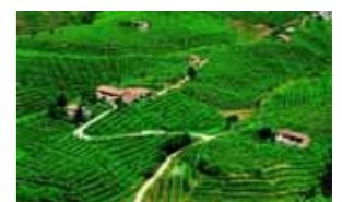
Strada del Prosecco